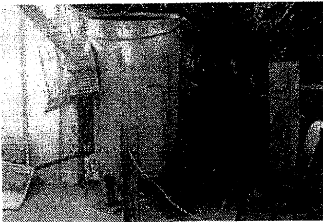
מכונת הקילוף מתיק הראיות בבית המשפט

לפני כשש שנים התחשמת למוות מנהל העבודה במפעל "משה ירקות קילופים" באבן יהודה ■ לאחרונה קבע בית המשפט כי בני משפחתו יפוצו בסכום של כ-660 אלף שקלים ■ והביטוח הלאומי יפצה אותם ב-780 אלף שקל