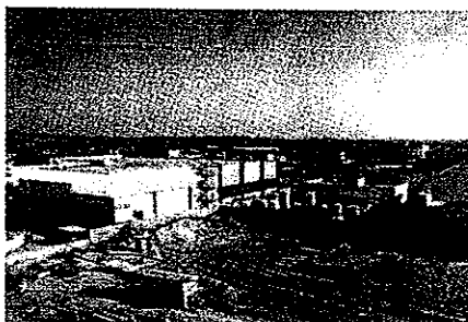
אזור תעשייה בדקן. ז'א הציבו שרטי אזהרה