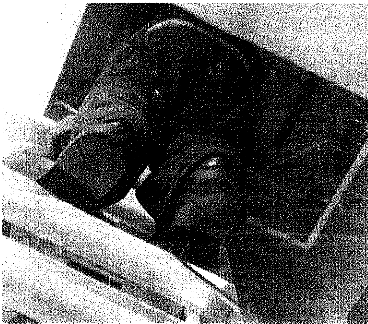
טכנאי החזיר את בעלת הבית באשר לבלב ■ צילום אילוסטרציה: jupiter images