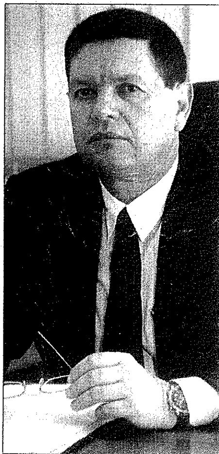
רשלנות תורמת. עו"ד שטמלר

משרד הבריאות יפצה ב-250 אלף שקלים תושב נתניה (37) שעבר בשרברכות בבית חולים הלל יפה בחדרה, לאחר שנפל מסולם במהלך עבודתו ושבר את פרק ידו.