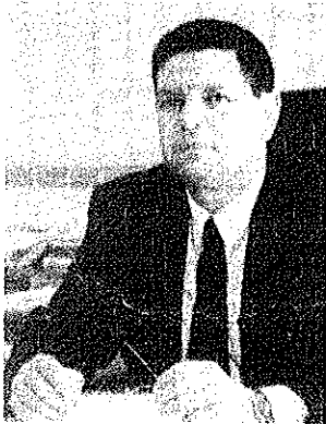
הגל התחיל מסכין מטבח. עו"ד שטמלר

תושב העיר נותר נכה בעקבות הדקירה ויפוצה במסגרת הסכם פשרה. זאת אחרי שטען לרשלנות של הפנימייה בכך שלא החזיקה מורה מפקח בחצר וימנע קטטות