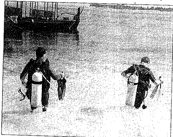
התובע אובחן כסובל מחבלות בעינו • צילום אילוסטרציה

של התובע בשיעור של 20 אחוז. התביעה טענה כלפי חברת הצלילה ומי מטעמה, כי הם סיפקו לתובע מכשיר פגום לצורך ביצוע הצלילה ולא קיימו פיקוח על ציודי הצלילה. כמו כן נטען, כי הם הפרו את החובות והאיסורים המוטלים עליהם שלא להדריך שום חניך, אלא אם יש בידיהם בטיחות תקיף המכסה את חבותם לשלומם ובריאותו של ההליך. נגד רשות הצלילה נטען, כי לא הפסיקה את פעילותו של המקום על אף שלא מילא את חובת רכישת הביטוח.