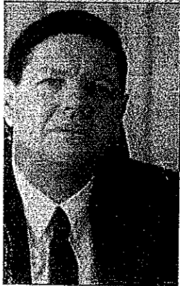
סטיה מנורמות התנהגות. עו"ד

בישיה הכללית בסיחותיים והבלתי מתוחזקים כראוי. נכתב ההגנה טענו העירייה וחברת הביטוח כי מעולם לא נמסר להן על מפגע במקום כמו כן טענו כי בתי המשפט פסקו לא פעם כי כנישים ודרכים אינם משטח סטריילי ושי קעים ובליטות הינם חלק אינטגרלי ממבנה רדף, ואין בעצם הנפילה כרי להטיל אחריות על העירייה. הגמבעות הוסיפו כי האחריות לנפילה היתה על התובע עצמו. במהלך הדיון בבית משפט השלום בנתניה, הגיעו הצדדים להסכם פשרה לפיו תשלם חברת הביטוח והעירייה לתובע סך 165.680 שקלים. השופט חאלה כנוב נתן לפשרה תוקף של פסק דין.